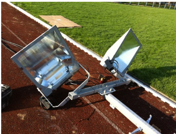
Im Rahmen des Programms wurden 40 Scheinwerfer ausgetauscht