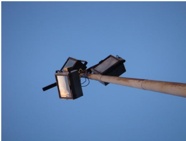
In Brinkum wurde vor wenigen Tagen das Sanierungsprogramm abgeschlossen

Begonnen hat die Sanierung eigentlich schon früher: Das Ingenieur-Büro Rößler wurde 2008 mit der Erstellung von Revisionsgutachten über die vorhandenen Altanlagen und der Entwicklung von wirtschaftlichen Sanierungskonzepten beauftragt, die dann den Beteiligten vorgestellt nach einer Prioritätenliste abgearbeitet werden sollten.